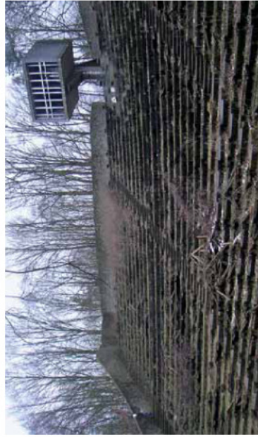
De vervaltribune van het openluchttheater De Lichtenberg, met regiecabine

Momenteel wordt er ook wetenschappelijk onderzoek verricht naar het oeuvre van architect Pierre Weegels. Dit wordt uitgevoerd door Lucas van Zuijlen van de TU Delft. Daar naast schrijft Eva van Wetsteyn, studente Kunstgeschiedenis te Nijmegen, haar afstudeerscriptie over De Lichtenberg, met een biografie van de architect. De gegevens van de onderzoektoestelling over Weegels tijdens de Open Monumentendagen van dit jaar. Deze expositie vindt plaats vanaf 8 september 2007 tot en met 6 januari 2008 in het gemeentemuseum de Tiendshuur in Weert. ❦